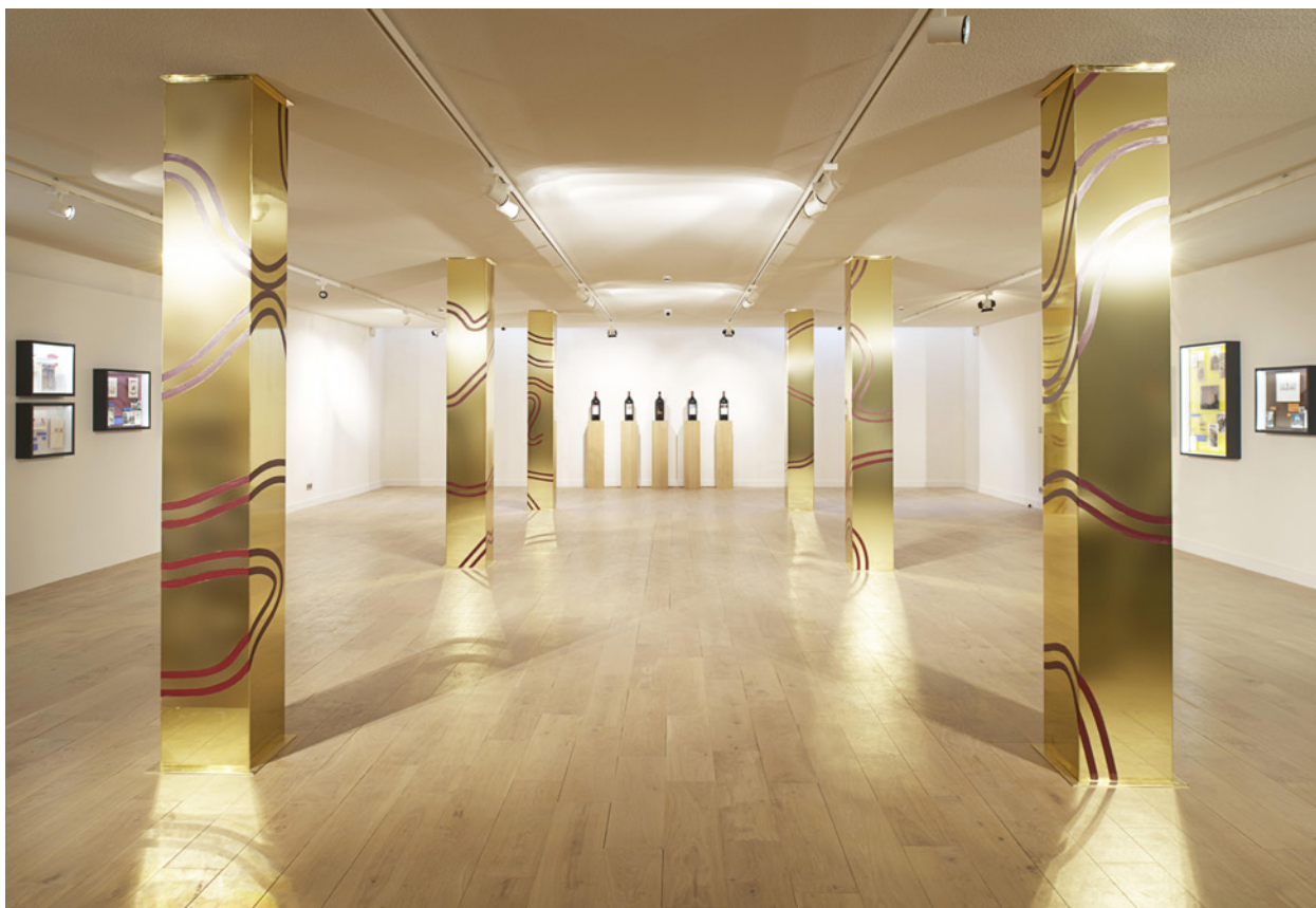
Экспозиция выставки The l'Art et l'Etiquette.