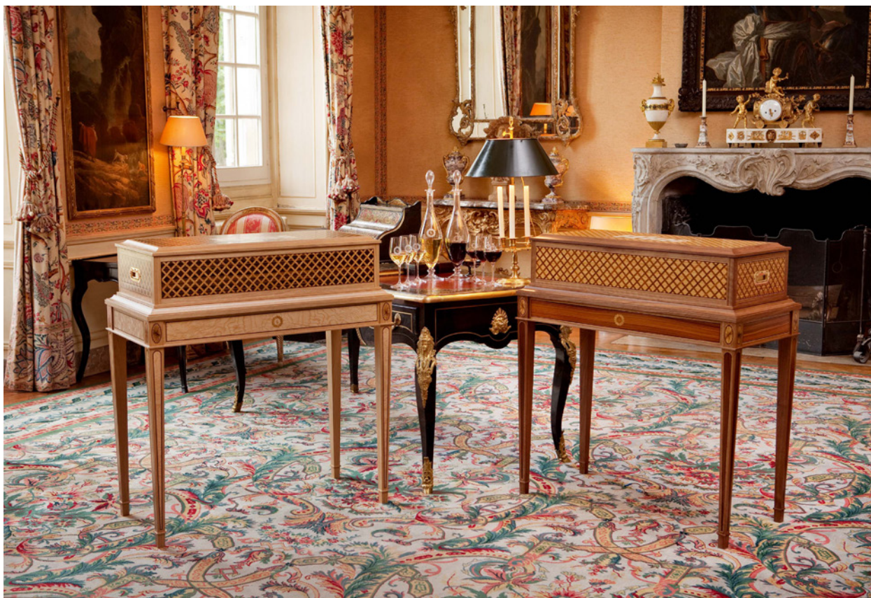
Винный кабинет в Château de la Clémentine.